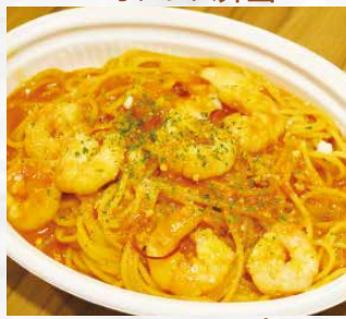
▲トマトクリームパスタ